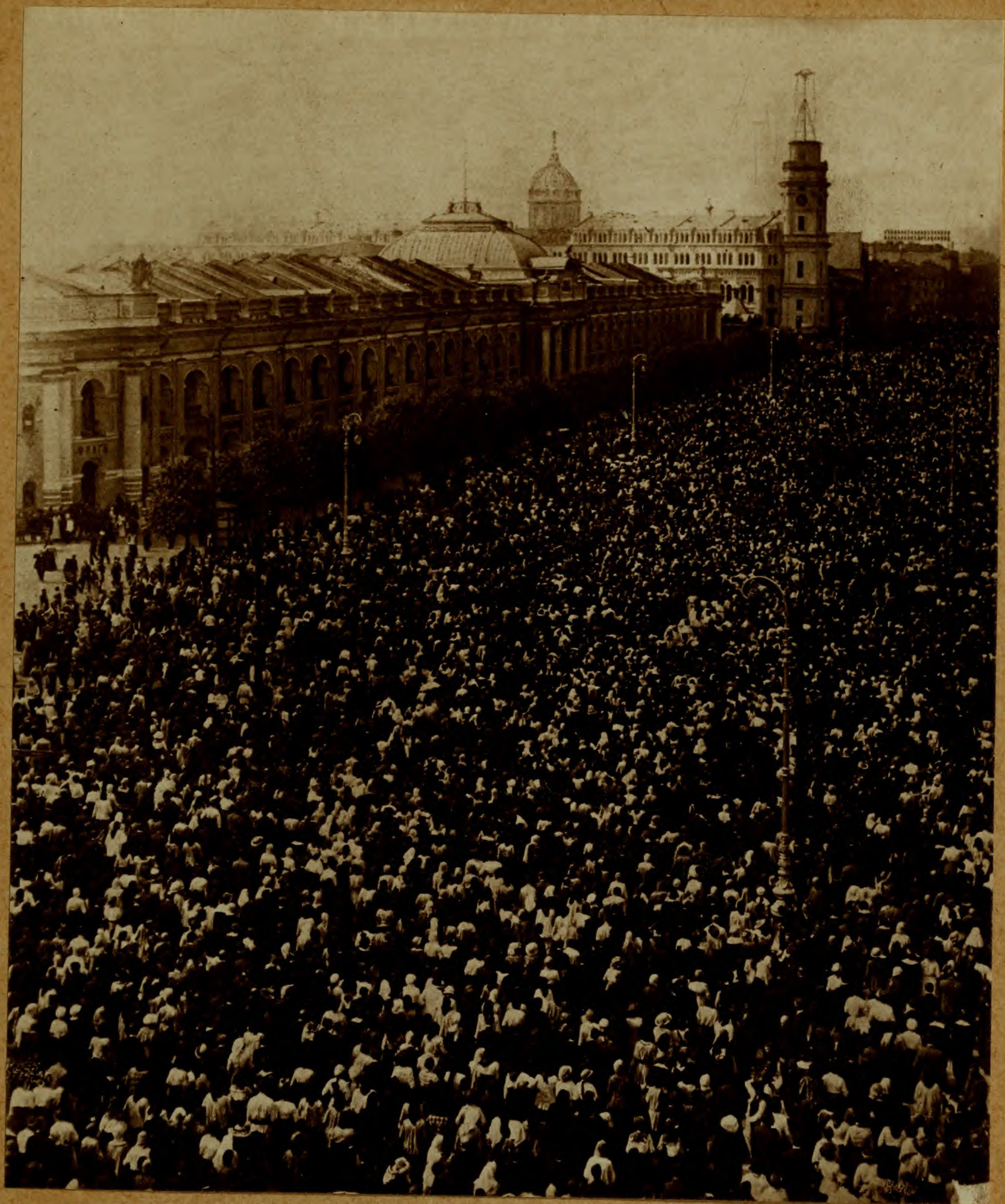
Крестный ходъ 8-го іюля 1915 г. въ Петроградѣ на Невскомъ проспектѣ.